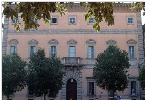
Tenza di Orvieto

• Tel: 0744300181 E-mail: tr1090000p@pec.gdf.it