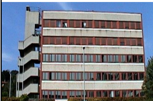
Nucleo PEF e Gruppo di Terni

• Tel: 0744300181 E-mail: tr0510000p@pec.gdf.it